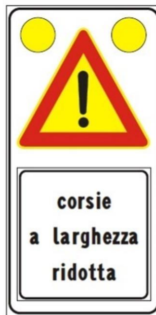
Figura II 391c Art. 31