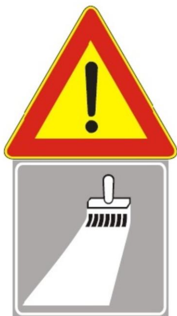
Figura II 391 Art. 31